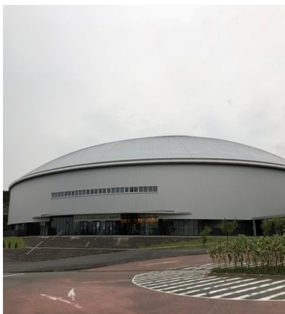
伊豆ベロドローム